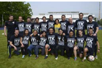
ITK Fußball in Spanisch