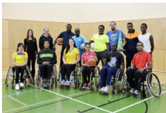
ITK Behindertensport in Englisch