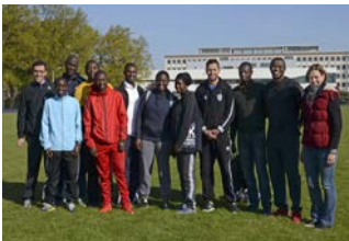
ITK Leichtathletik in Französisch