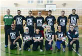
ITK Volleyball in Arabisch