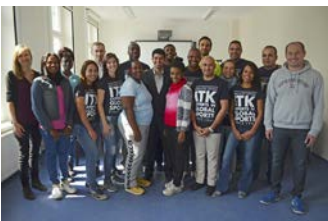
ITK Sportmanagement in Englisch

Mit der feierlichen Zeugnisübergabe endet am 29. Juli für 66 Teilnehmer aus 36 Ländern der 1. Internationale Trainerkurs 2016. Es wurden die Kurse Volleyball in Arabisch, Behindertensport in Englisch, Leichtathletik in Französisch, Fußball in Spanisch sowie zum zweiten Mal Sportmanagement auf Englisch durchgeführt.